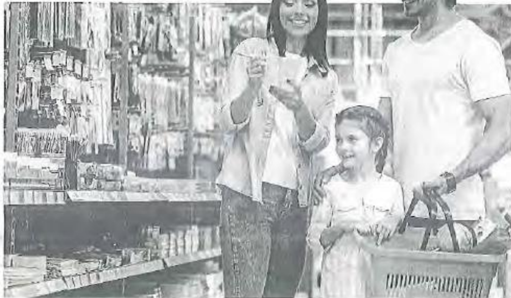
La escuela te dará la lista de útiles.