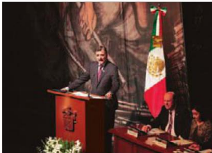
Tonatiuh Bravo, rector de la UdeG, en su quinto informe de actividades.

“Hace cinco años propusimos un Pacto por los Jóvenes y asumimos compromisos para contribuir a las metas presidenciales y del Gobierno del Estado en materia de crecimiento y atención educativa en los niveles medio superior y superior. Hoy la UdeG tiene casi 45 mil estudiantes más, distribuidos en las regiones de Jalisco y cuenta con una oferta más diversificada y pertinente”; se refirió en torno a la institución que dirige, misma que fue galardonada el año pasado con