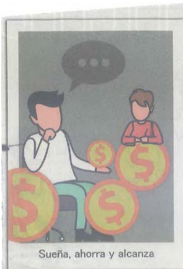
Sueña, ahorra y alcanza

Se trata de una exposición y taller sobre educación financiera y económica con los personajes de Plaza Sésamo en el Museo Interactivo de Economía (MIDE). Está compuesta por nueve secciones: taller de huertos caseros, taller de cómics,