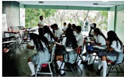
Los militares y elementos de seguridad incluso vigilaron dentro de los centros escolares.

Según Álvarez Heredia, a medida de que los padres de familia y maestros tengan más confianza, los demás planteles educativos serán re-