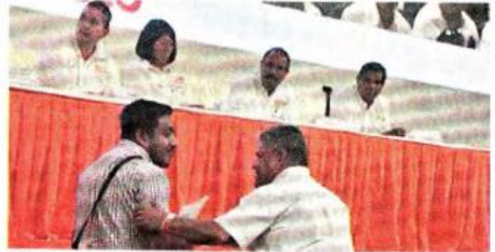
■ Elementos de seguridad impidieron a un maestro entregar una suspensión de amparo al pleno del Congreso General.

“Luego que el juez determine si procede o no la suspensión definitiva, luego de escuchar a la contraparte, en este caso el Tribunal Federal de Conciliación y Arbitraje, en ese momento el juez tendrá que decidir si subsiste o no subsiste la suspensión”,