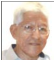
Por Ángel Soriano

Es un problema que compete a ambas naciones y el nivel de colaboración siempre ha sido recíproco, respetando la soberanía de cada país, pero de ninguna manera aceptando una abierta intromisión y menos con el arribo de tropas estadounidenses como es la intención del señor Trump