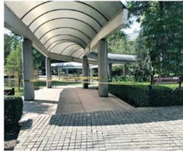
■ Los accesos al edificio de la Secretaría Técnica del IPN permanecen bloqueados por la negativa de admitir el cambio de carrera de 60 estudiantes.