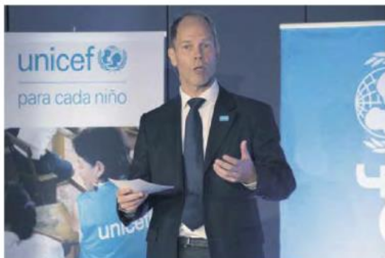
El representante de UNICEF en México, Christian Skoog, dijo que si la normativa existente se aplicara, el número de escuelas dañadas habría sido menor.

Dijo que si la normativa existente se aplicara "al 100%" en todo el país, el número de escuelas dañadas habría sido menor y explicó que algunas de las escuelas más dañadas se construyeron antes de que México mejorara la regulación de las construcciones por lo que es necesario asegurar que "todas las escuelas e instala-