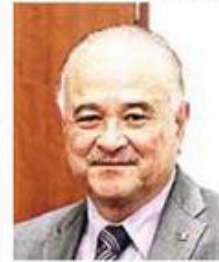
Ernesto Ruffo Appel Senador del PAN

El rector de la UNAM anunció que se unirá a la concentración pacífica en defensa la soberanía y dignidad del país, convocada para el 12 de febrero. Enrique Graue propuso una estrategia para apoyar a los estudiantes que lleguen a ser deportados de Estados Unidos, y llamó a los académicos a generar nuevas propuestas para el desarrollo de México.