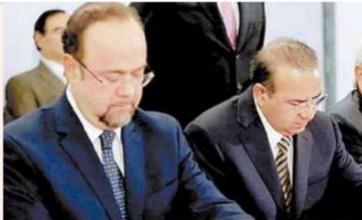
El titular de la ANUIES, Jaime Valls Esponda, y el secretario de Gobernación, Alfonso Navarrete Prida signaron el documento.

Es imperativo, subrayó, ir al fondo y mejorar la calidad de nuestra democracia y en general de nuestra vida pública. Es esencial por ello, asegurar la vigencia del estado de derechos, que devuelva y robustezca la confianza de los ciudadanos en sus instituciones