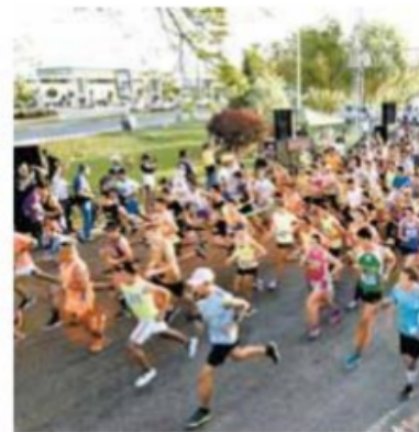
La tradicional carrera ya es uno de los eventos más importantes de Tabasco.