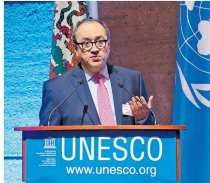
Otto Granados solicitó el apoyo de la UNESCO para seguir implementando la reforma educativa

Pero más allá de esos logros, la reforma busca un cambio radical en el sistema educativo mexicano, apostando por los principios de la libertad, la razón, la justicia y el bienestar de las personas, aseguró en titular de la SEP ante Audrey Azoulay,