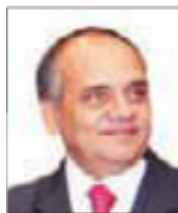
Dr. Manuel Añorve Baños

En cinco años de gobierno, los usuarios de internet en México pasaron de 41 millones a 71 millones, es decir, casi se duplicó el número de usuarios, gracias a la mejora en la accesibilidad a estos servicios. Ahora es importante continuar con la democratización de este derecho, al tiempo que se aprovechen sus bondades, y relacionarlo con el sector educativo, en el que actualmente ya se tienen 70 mil escuelas conectadas en todo el país.