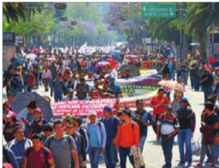
Desde muy temprano los integrantes de la CNTE desquiciaron el tránsito.

“¡Cuando el pueblo se levanta por pan, libertad y tierra, temblarán los poderosos de la costa