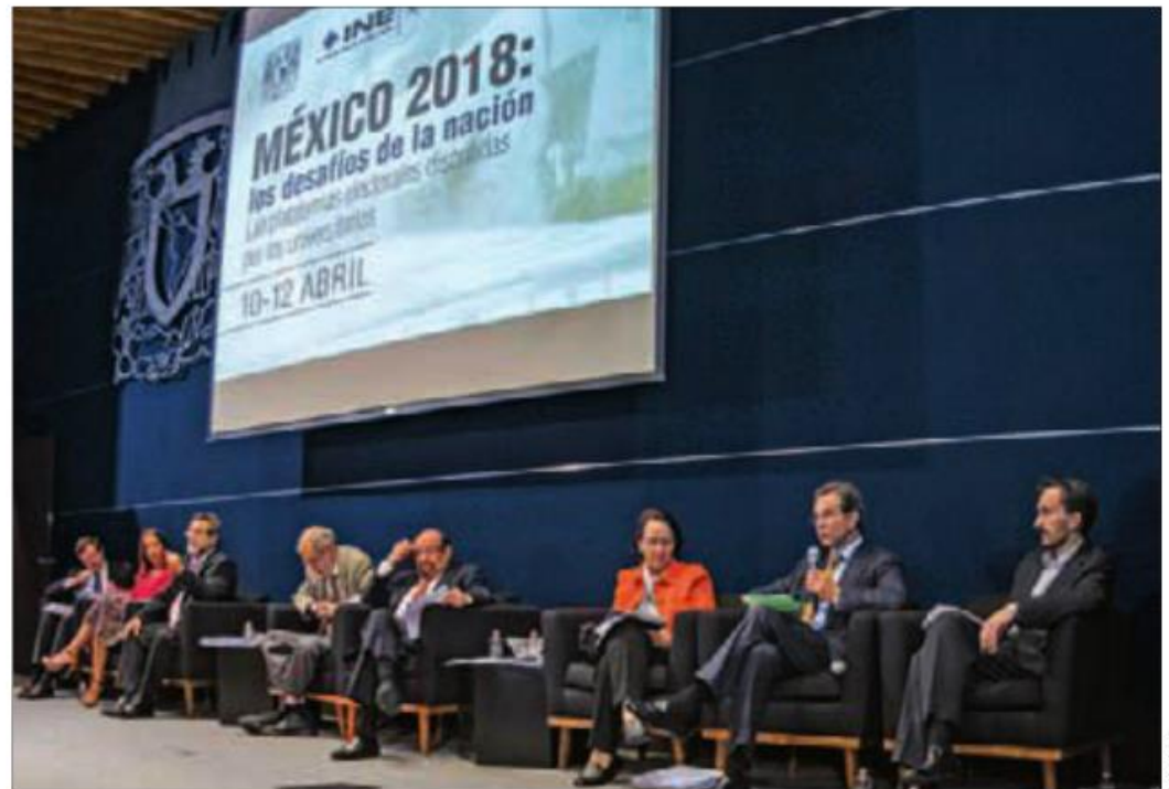
Con el panel "Educación, ciencia y tecnología para el desarrollo" iniciaron los foros convocados por la UNAM.

En ese sentido, los universitarios dijeron que la UNAM y la Asociación Nacional de Universidades e Instituciones de Educación Superior (ANUIES) presentarán dos agendas que podrían ser la base de los proyectos de los candidatos y futuro presidente del país, en materia de ciencia y educación superior, respectivamente.