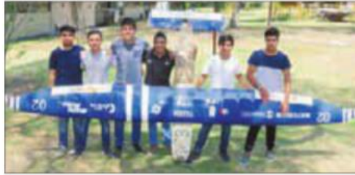
El equipo Kukulcán Aerodesign pertenece a la ESIME Ticomán .

El prototipo Yaxkin , que en lengua maya significa sol nuevo, tiene una dimensión de 4.4 metros, cuenta con un motor eléctrico de mil watts y una hélice de 4.3 kilogramos, su fuselaje es de tipo armadura y se diseñó median-