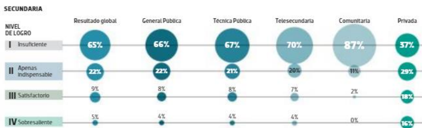
Porcentaje de estudiantes en cada nivel de logro en la prueba Plana de Matemáticas, 2017