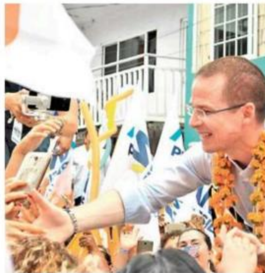
El panista llamó a votar por los gobiernos de alternancia que castigan a los corruptos

Anaya Cortés felicitó a los veracruzanos