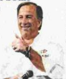
JOSÉ ANTONIO MEADE KURIBREÑA Candidato de la coalición Todos por México

“La educación no puede ser un botín político. López Obrador quiere sacrificar la educación de nuestros hijos a cambio de votos, ¡no lo vamos a dejar!”