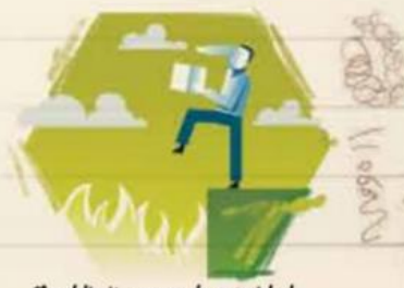
No delimita zonas de seguridad o de protección civil