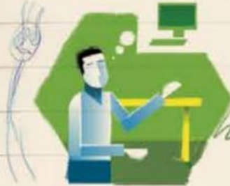
Carece de sala de cómputo