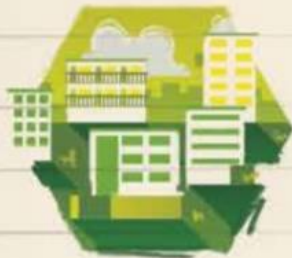
Se ubica en el lugar 893 de mil 342 escuelas en la ciudad

La escuela de Tláhuac que se está cayendo a pedazos tiene una calificación de 6.8 en infraestructura y desempeño académico, de acuerdo con el IMCO > 5