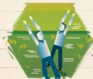
No señaliza rutas de evacuación o salidas de emergencia