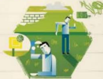
No tiene áreas deportivas o recreativas