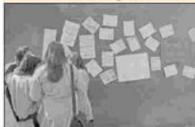
Estudiantes enfrentan mala calidad de la educación y de ofertas en el mercado laboral, según Del Tronco Paganelli.