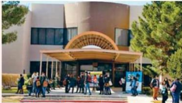
La matrícula universitaria hoy significa entre 37 y 38 por ciento.

Destacó que bajo el liderazgo de la ANUIES y del programa Visión Y Acción 2030, se fortalecen las políticas para el desarrollo social y económico del país.