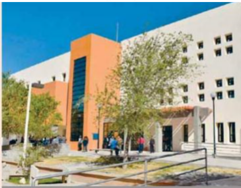
La UACJ fue sede de una sesión ordinaria del CUPIA.

■ RESPALDAR RESULTADOS. Los encuentros con los candidatos a la Presidencia de la República comienzan hoy y concluyen mañana en las instalaciones del Centro de Innovación y Desarrollo de la ANUIES. Los rectores deberán aprovechar el foro para desmenuzar y entender hacia dónde va cada uno de los proyectos y determinar, ellos como cabezas de las instituciones de educación superior, lo que más conviene al país en aspectos como cobertura, calidad, deserción, internacionalización, evaluación, rendición de cuentas, financiamiento, actualización de los planes y modelos de