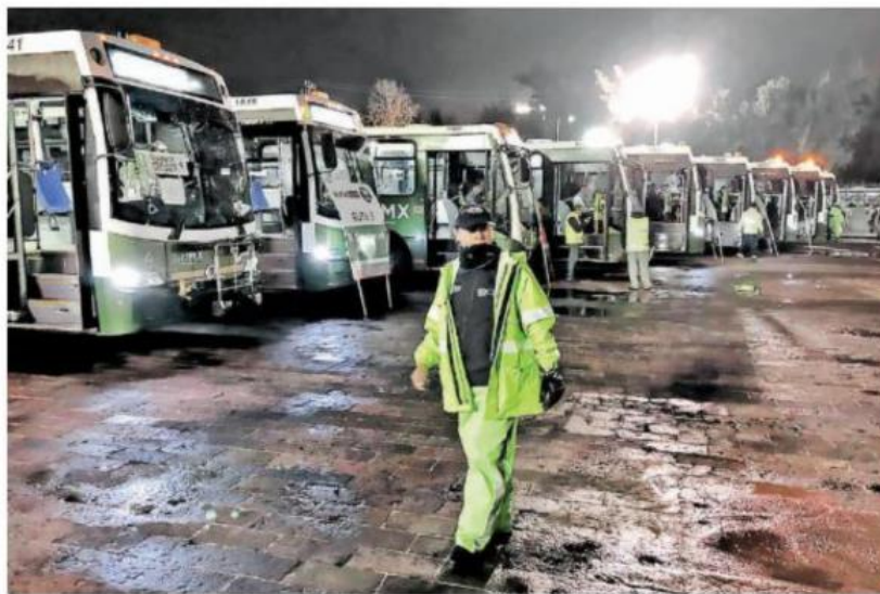
Los camiones M1 se encargarán del traslado de los estudiantes