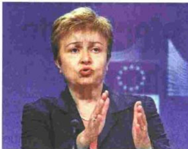
Kristalina Georgieva, directora ejecutiva del BM, dijo que muchas personas pobres se ven frustradas por la desigualdad.