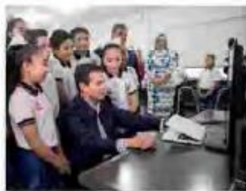
EL MANDATARIO cumplió ayer su compromiso de visitar un plantel.

El Presidente destaca ejemplo del plantel Ignacio Zaragoza, de Monterrey, condecorado por su calidad; quien no invierte en la educación de niños y jóvenes condena el futuro del país, asegura. pág. 8