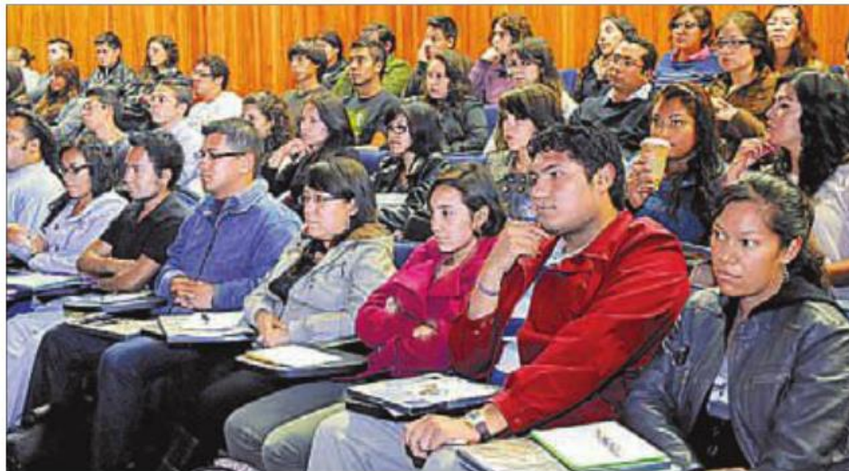
La relación pedagógica entre alumnos y profesores no ha cambiado en un siglo, pero la tecnología y la forma en que se aprenden jóvenes sí.

"Desconocen las transformaciones que la tecnología y la economía generarán en el mundo profesional y laboral, como pa-