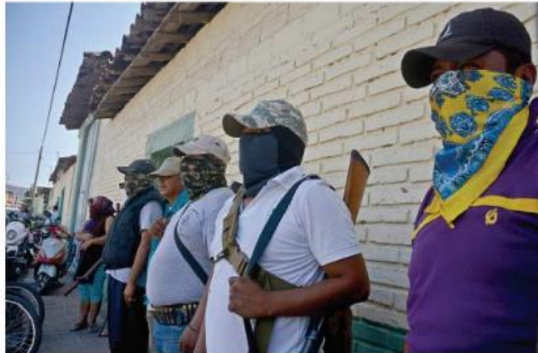
■ Civiles armados temen que lleguen a la comunidad miembros de ‘Los Tequileros’ a cometer ilícitos.

Desde diciembre, unos 3 mil estudiantes siguen sin