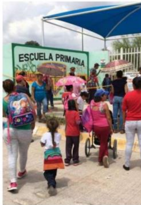
Hay 740 mil 250 alumnos

El oficio No. 115/2018 explica en cinco puntos como se manejarán los recursos que se establecerán en el Manual para la