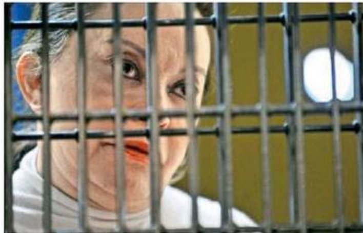
Elba Esther Gordillo