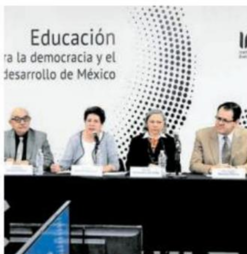
Consejeros del INEE dijeron que se nota el avance democrático

Resaltaron que la jornada electoral se dio en un ambiente cívico de colaboración y respeto. "Una vez más, este ejercicio democrático ha puesto de relieve la