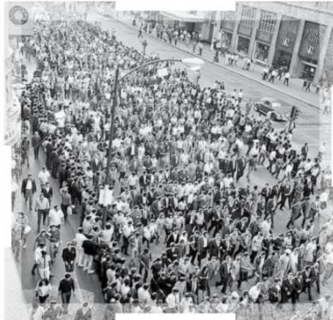
El reclamo de los jóvenes era equivalente a la cerrazón de las autoridades durante esos tiempos autoritarios.

“Esto, ante los embates autoritarios que pretenden desconocer y menoscabar la dignidad de las personas; hay que reconocer la trascendencia y repercusiones de ese movimiento en la transforma-