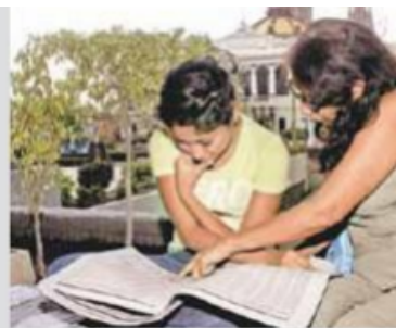
Los apoyos permiten a los alumnos desarrollarse.

La Beca para los hijos/as de Policías Federales, en servicio activo o fallecidos en servicio, es un apoyo económico de hasta 4 meses en pago único. El monto va de 2 mil 600 a 3 mil 500 pesos, de acuerdo al género y al semestre en el que se encuentre el estudiante. Como