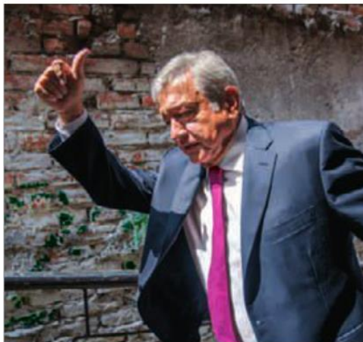
López Obrador se negó a detallar cuánto ganará.

Este lineamiento también pretenden aplicarse a los funcionarios de órganos autónomos co-