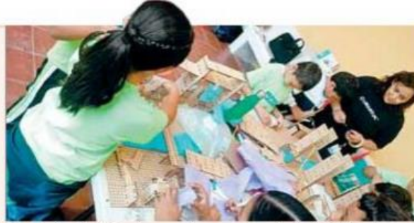
En el taller, los infantes construyeron una ciudad inteligente.

En el segundo día del taller de innovación, el tema fue Ciudad Incluyente. Los estudiantes