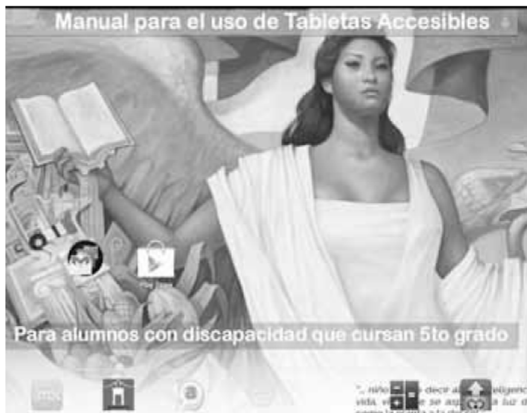
La SEP y sus cuentas chuecas.

Finalmente dijo que las becas de manutención en Veracruz no se realizaron, ya que el gobierno de ese estado no realizó el total de las aportaciones al fideicomiso de los ciclos escolares 2014-2015 y 2015-2016; y, el fideicomiso del estado de Veracruz, a la fecha de la auditoría (septiembre 2016), no ha realizado el reintegro a la Tesorería de la Federación.