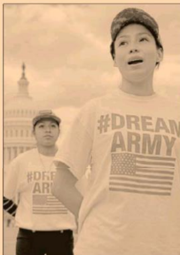
Algunos jóvenes reciben apoyos del gobierno de México.

La ASF precisó que en el 2015, el IME tuvo un presupuesto de 16 millones de pesos para el pago de becas (IME-Becas), a fin de apo-