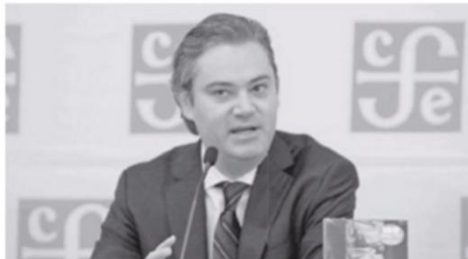
Aurelio Nuño, secretario de Educación Pública, destacó la fortaleza actual del Sistema Educativo Nacional, al recordar los cambios que en la materia ha tenido la Constitución en los últimos cien años

Añadió que los principios de la Carta Magna son el eje constituyente de 1917, algunos de ellos como la división de poderes, el sistema democrático, la representación y el