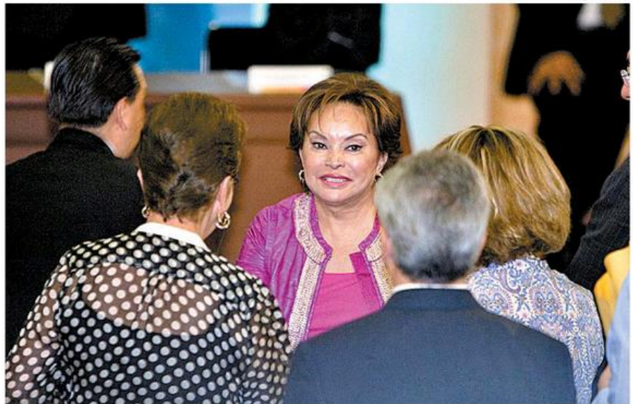
La ex lideresa magisterial.

En el fondo, la profesora cometió uno de los más graves pecados en política: la soberbia. Creyó que todo el tiempo tendría