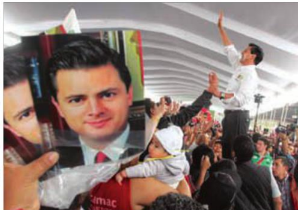
El presidente Enrique Peña, en los buenos tiempos del Pacto por México al inicio de su mandato.

La gran incógnita es si la administración entrante dará continuidad a las reformas o cortará el proceso de avance e implementación