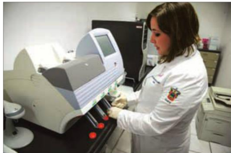
El Foro Consultivo recomienda contabilizar de forma adecuada el equipamiento de la infraestructura de investigación.

Son recomendaciones sobre qué rubros deben contabilizarse y dar seguimiento, añade, y saber cómo se realiza