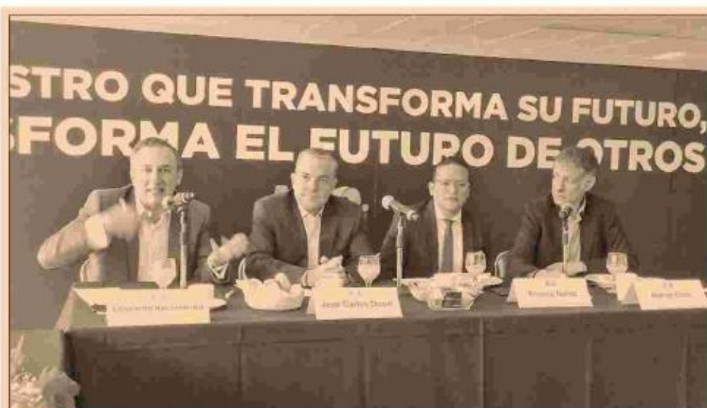
Directivos de UNOi coincidieron en que no basta dotar de tabletas a los educandos.

Presentan modelo de tendencia mundial que busca innovar para desarrollar habilidades y competencias