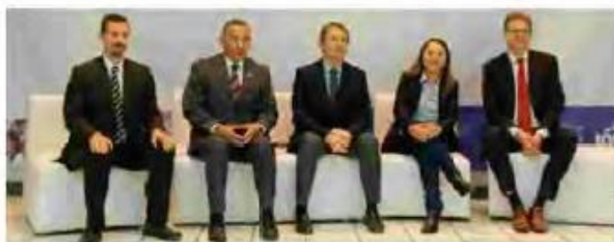
CONFIANZA. Autoridades, escuelas y directivos de Nestlé creen en el desarrollo. SANTIAGO DE QUERÉTARO, QR ENVIADA

MÓNICA FUENTES monicas@elfinanciero.com.mx