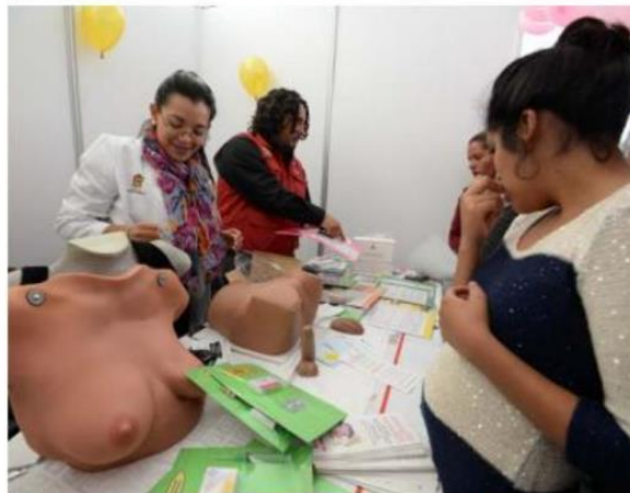
Orientación sexual en un taller en el Estado de México

"Garantizar una educación integral en sexualidad, para impulsar y fortalecer el