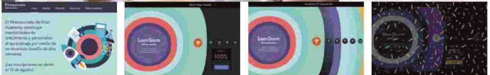
En una prueba preliminar, este concurso se realizó en 2017 con la participación de 75 mil alumnos mexicanos, por lo que se espera que este año la convocatoria sea mayor y promueva el entusiasmo por el estudio y la mentalidad de crecimiento.