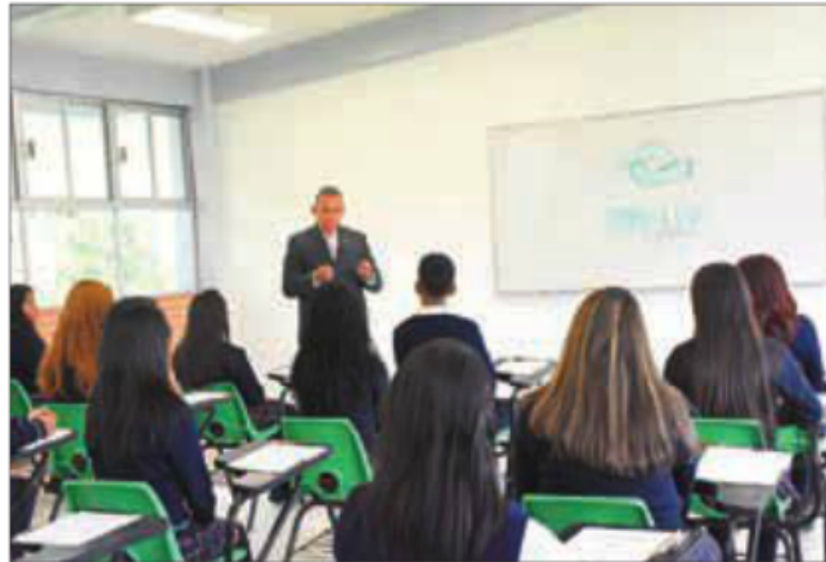
Los estudiantes podrán cambiar libremente de subsistema educativo entre el primero y tercer semestre.

El Modelo Académico CONALEP 2018, dará respuesta a los desafíos que enfrentan los alumnos, quienes estarán pre-