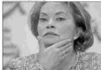
En días pasados un juez decretó la libertad de Elba Esther Gordillo Morales, líder histórica del SNTE.

Al interior de la CNTE se habla de "una guerra" por el control del Sindicato Nacional de Trabajadores de la Educación (SNTE)