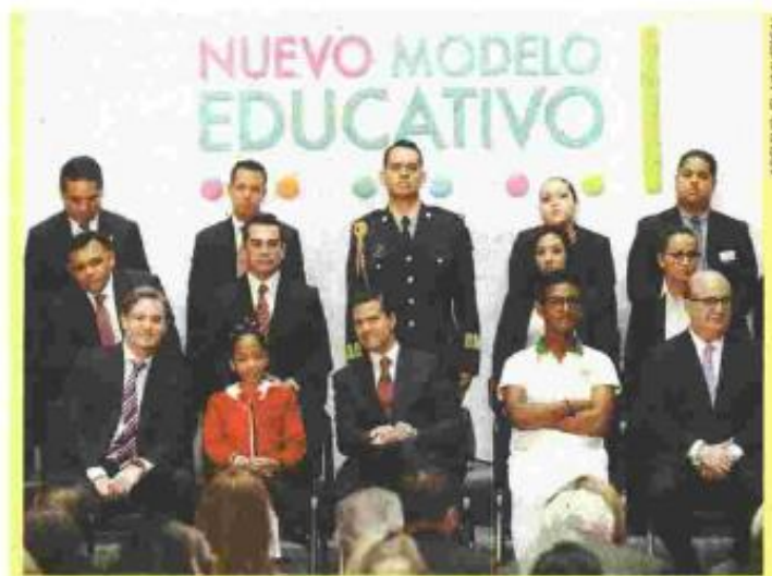
El nuevo modelo educativo fue promovido por el ex secretario de Educación, Aurelio Nuño Mayer, y el presidente Enrique Peña Nieto.