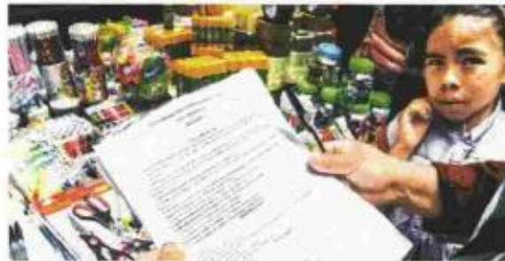
Autoridades piden a padres denunciar abusos en negocios.

El costo se incrementa para los alumnos de escuelas privadas, advierte Profeco