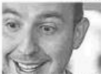
Marko Cortés, líder de los diputados federal del PAN.

“ Llama la atención la coincidencia de la liberación (de la maestra) con el día en que Andrés será presidente electo. Puede ser el inicio de la amnistía que Andrés ha ofrecido (...) Ya es cosa juzgada, pero llama la atención la coincidencia del día”.