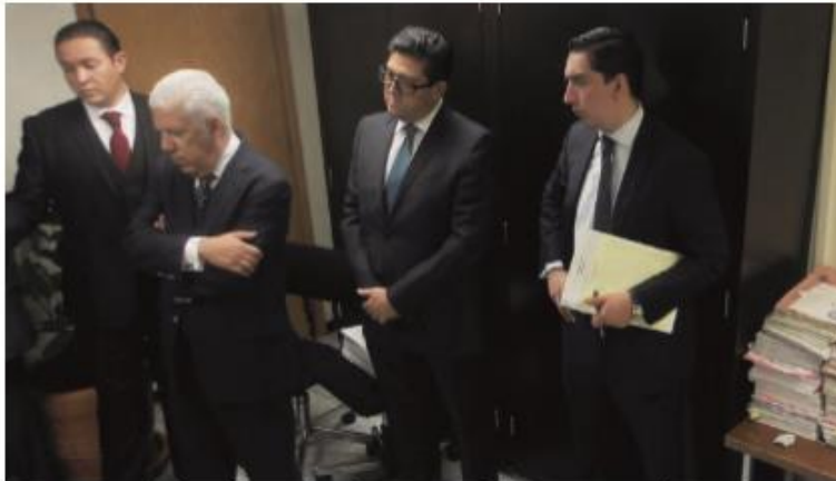
ABOGADOS de la exlideresa acuden a juzgados para revisar el caso, en 2015.