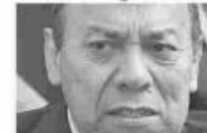
Jesús Zambrano, exdirigente nacional del PRD.

“ No tiene nada ver eso. Es una mala coincidencia. No creo que él tenga tanto poder como para influir en los órganos jurisdiccionales. Y ya lo escucharon: ni lo piensa hacer ni lo ha hecho. Es una mala coincidencia pero es una resolución del Poder Judicial que se va a respetar.