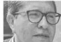
Ricardo Monreal, próximo coordinador de los senadores de Morena.

“ No tiene nada ver eso. Es una mala coincidencia. No creo que él tenga tanto poder como para influir en los órganos jurisdiccionales. Y ya lo escucharon: ni lo piensa hacer ni lo ha hecho. Es una mala coincidencia pero es una resolución del Poder Judicial que se va a respetar.