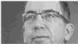
Javier Lozano, senador de la República y exvocero de la campaña presidencial de José Antonio Meade.

“ La detuvieron sin fundamento jurídico, por razones políticas; la mantuvieron detenida durante cinco años, sin acreditar su culpabilidad; se vieron obligados a liberarla, por razones políticas y jurídicas. Nadie gana con esto, pero es el momento, más que nunca, de defender una causa que a muchos imbéciles y a buenos amigos inteligentes les molesta: el debido proceso vale para los buenos y malos, para los que me caen bien y los que me caen mal, para mis amigas y mis enemigos.