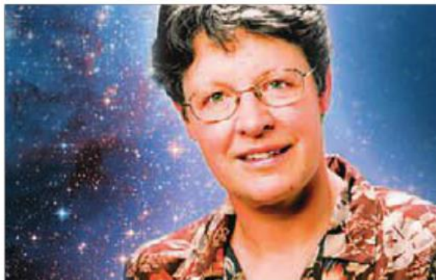
Jocelyn Bell Burnell es conocida por haber descubierto los pulsares. George Smoot hizo descubrimientos de la radiación cósmica de fondo.

Un pulsar es una estrella de neutrones que emite radiación periódica. Debido a su intenso cam-