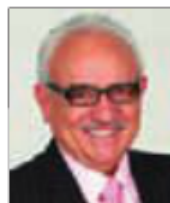
Gilberto Guevara Niebla

Otra estrategia es la que permite que cada alumno diseñe su propio plan de trabajo abordando determinados contenidos curriculares siguiendo su ritmo y nivel personal; en ocasiones esta estrategia se sustenta en un documento llamado contrato que se redacta mediante una negociación entre maestro y alumnos. En fin, en otra oportunidad, abordaré otras estrategias de organización del trabajo en el aula.