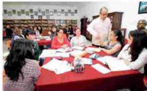
EL SECRETARIO Otto Granados con docentes de la escuela primaria y jardín de niños "Benito Juárez", ayer.