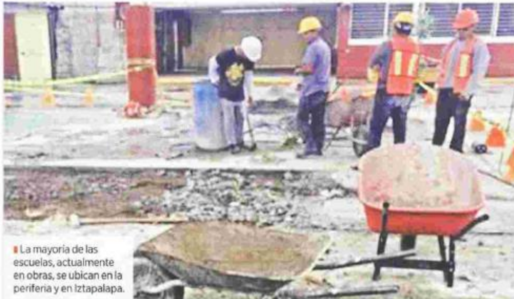
La mayoría de las escuelas, actualmente en obras, se ubican en la periferia y en Iztapalapa.

Inicia el lunes ciclo escolar y los niños convivirán en 98 planteles con albañiles