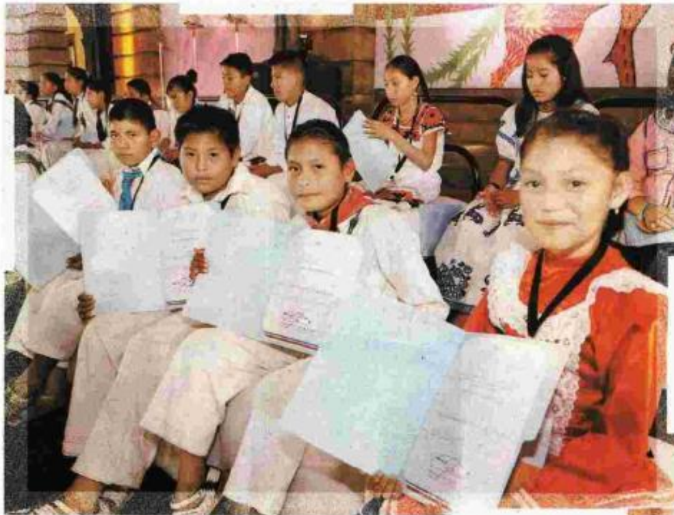
Los cambios en la maquinaria educativa han favorecido a los estudiantes de menos recursos.

El cambio de administración es cuestión de meses y permite garantizar una educación que ha impulsado la equidad hacia los sectores más rezagados y la pertinencia hacia las opciones con mayores oportunidades de desarrollo.