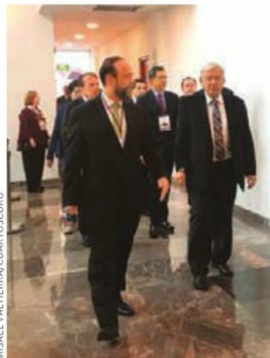
Camino al salón de conferencias.

"Las obras en las universidades públicas estatales se ejecutan bajo un esquema descentralizado, ya que a partir de 1998 se determinó que en relación con las instituciones de los niveles me-