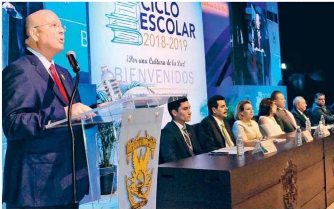
El gobernador del Estado, Quirino Ordaz Coppel y el rector Juan Eulogio Guerra Liera inauguraron las actividades.

Una vez más la institución realiza un esfuerzo para atender la demanda de aspirantes de nuevo ingreso