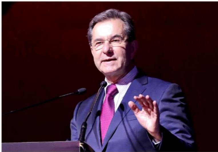
Esteban Moctezuma, futuro titular de la SEP, dijo que los ajustes al modelo educativo surgirán de un acuerdo entre todos los actores del sector.

"Cuando se dice 'voy a echar atrás la reforma educativa', lo que preocupa es si van a lograr o no corregir deficiencias y falta del uso de la evidencia para la pla-