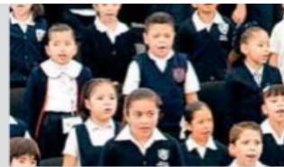
Las escuelas de tiempo completo muestran un alto desempeño.

› Antes, teníamos un mapa curricular que los vertiginosos cambios en el mundo del conocimiento y la pedagogía volvieron obsoleto. Hoy tenemos un Nuevo Modelo Educativo y un nuevo currículo que buscan hacer crecer integralmente a los alumnos tanto en su desarrollo intelectual como físico, artístico y emocional, sobre la base de la formación académica; el desarrollo personal, la educación socioemocional, y la autonomía curricular, una de las mayores