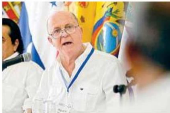
El rector general Miguel Ángel Navarro Navarro.

“Para cumplir con este propósito es necesario contar con una gestión pública eficaz, receptiva, incluyente y participativa, con gobiernos transparentes, colaborativos y promotores de la equidad y el bien común”, señaló du-