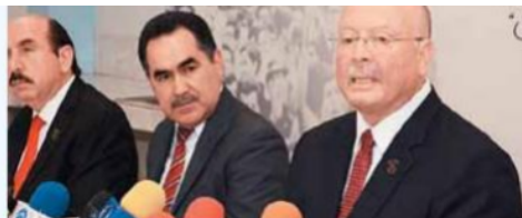
La institución colaborará con otras casas de estudio.

"Los objetivos son conmemorar el suceso que cambió la vida social y política del país, reflexionar sobre lo que esto significó y lo