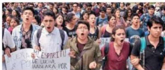
La comunidad se encuentra consternada por los hechos.

Las denuncias de los hechos ya fueron presentadas a la procuraduría y se procederá, sin mira-