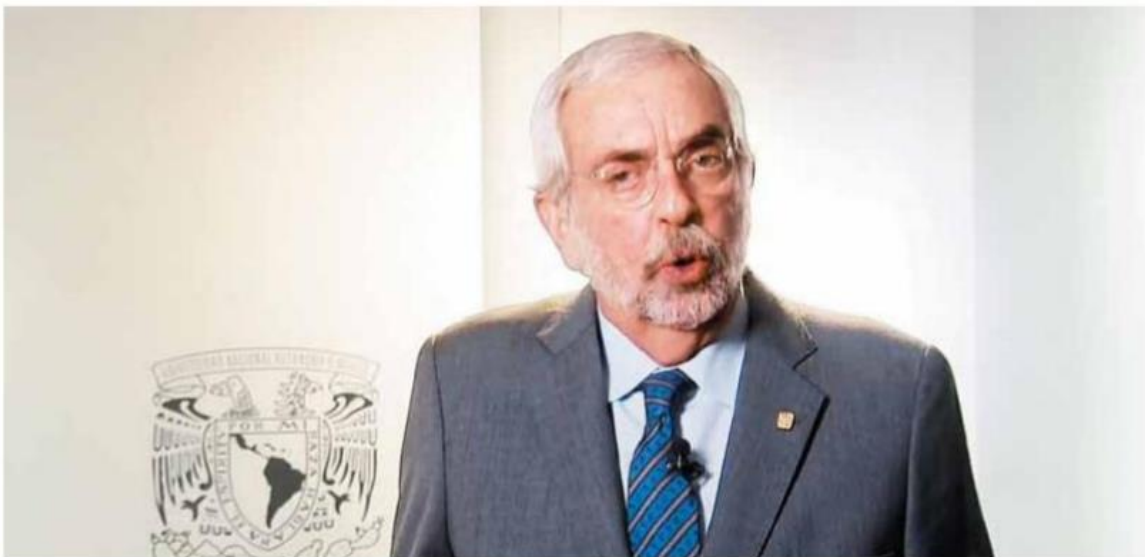
El rector de la UNAM, Enrique Graue Wiechers, dirigió un mensaje a la comunidad universitaria y a la sociedad sobre los recientes hechos.

Enrique Graue Wiechers resaltó que no descansará hasta ver desaparecer a los grupos porriles