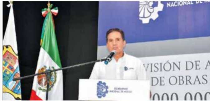
El titular de la institución, Manuel Quintero Quintero, supervisó avances de obras de infraestructura académica y de investigación.

■ Tecnológico Nacional de México (TecNM) cuenta en Matamoros con un plantel digno de la máxima casa de estudios tecnológicos del país, donde se preparan los ingenieros que serán los impulsores del cambio en Tamaulipas, expresó Manuel Quintero Quintero director general del TecNM.