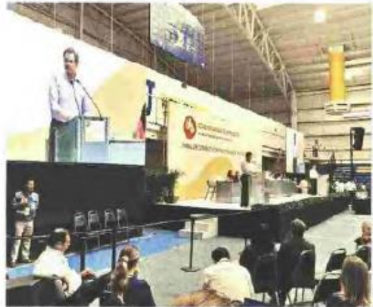
El próximo titular de la SEP, Esteban Moctezuma, encabezó en Nuevo León el foro nacional "Educación para el Bienestar".