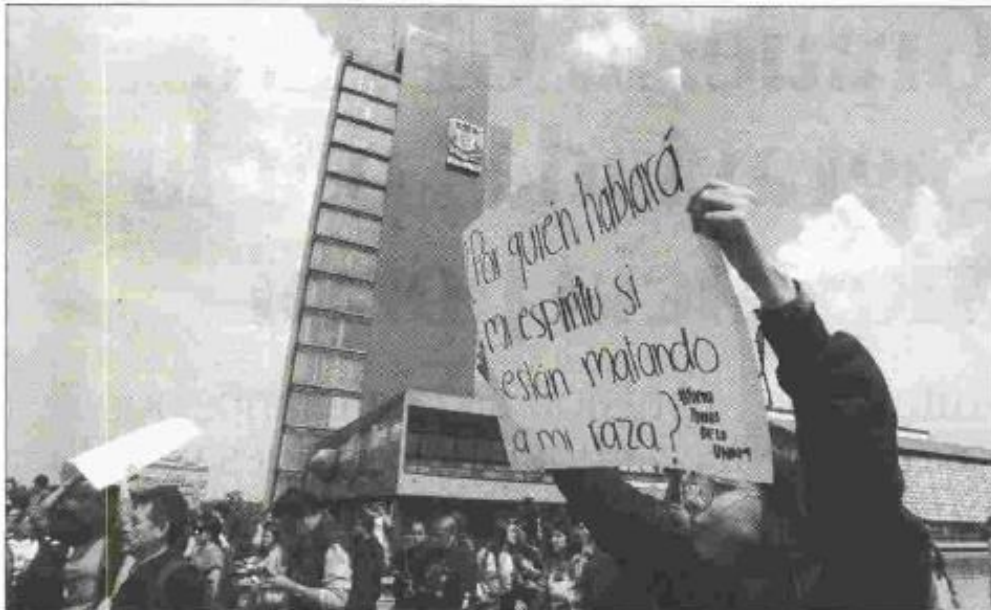
▲ Estudiantes de diversas escuelas se manifestaron este martes a un costado de la Rectoría de la UNAM.

ENRIQUE MÉNDEZ, ROBERTO GARDUÑO Y JESSICA XANTOMILA