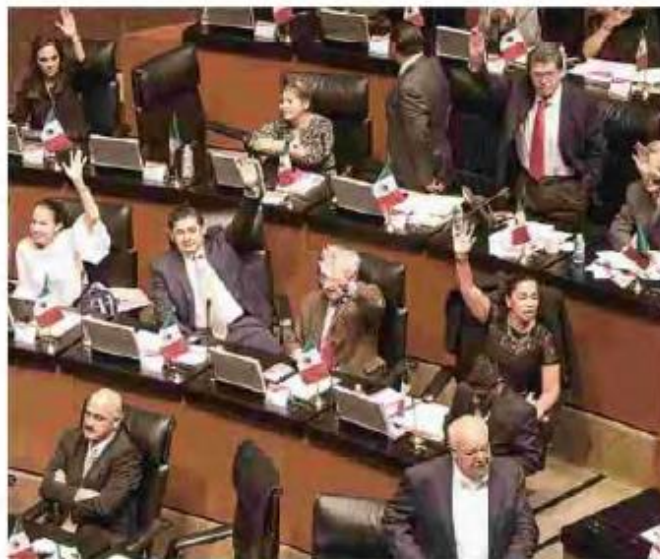
SESIÓN. Senadores, ayer, al emitir su voto para el exhorto.