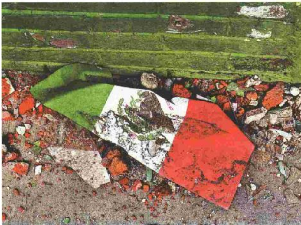
El organismo responsabiliza a los gobiernos locales.

La SEP reporta 10,857 planteles atendidos, pero Transparencia Presupuestaria, 9,757