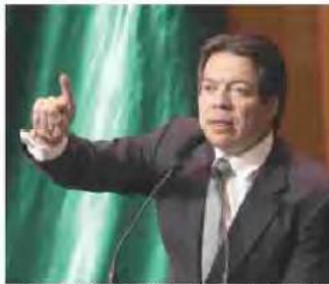
EL DIPUTADO Mario Delgado, dijo que no quedará "ni una coma de la Reforma Educativa", el 13 de septiembre.