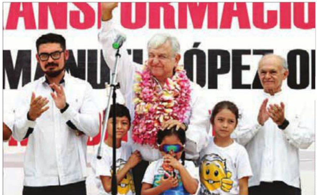
Andrés Manuel López Obrador, acompañado por el empresario Alfredo Harp Helú y Román Meyer, próximo titular de la Sedatu, realizó una gira en Ixtepec, Oaxaca.

Y añadió: "Esa reforma educativa no se va a aplicar, se va a quitar para que no ofenda a los maestros, pero creen en al-