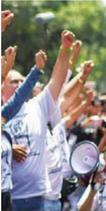
ISAAC ESQUIVEL / CUARTOSCURO