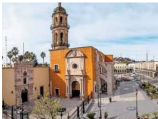
Recientemente renunciaron los rectores de la Universidad Autónoma de Tlaxcala y de la Universidad Juárez del Estado de Durango.

SE PIERDE LA DIMENSIÓN. En otro asunto en el que también está en juego la calidad de la educación, muchos medios han perdido la