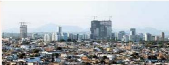
El encuentro busca avanzar hacia un buen gobierno del agua.

Es “una gestión radicalmente distinta que incluya todos los