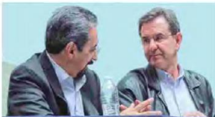
ENCUENTRO. Esteban Moctezuma [der.], ayer, en un foro educativo, en Morelia

El futuro secretario de Educación Pública asegura: "lo que vamos a construir será una educación con calidad"