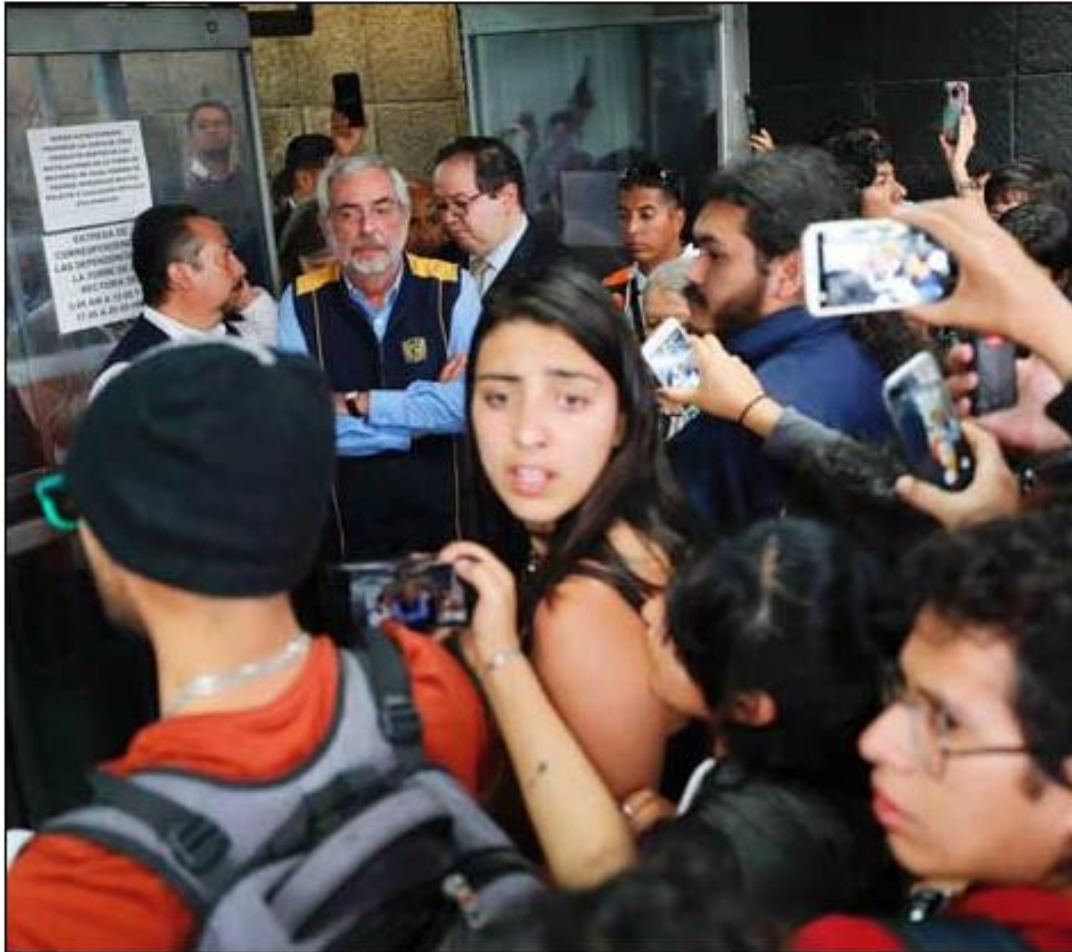
Graue cancela viaje para atender exigencia de estudiantes