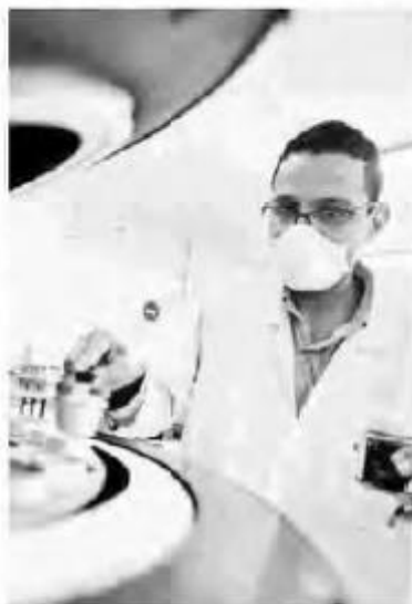
Los proyectos científicos se han visto afectados

En 2016 alcanzó 34 mil millones de pesos de presupuesto; para este año bajaron a 27 mil 225 mdp