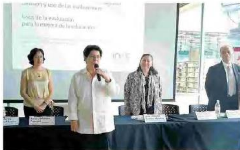
La presidenta del INEE señaló que la información obtenida en la evaluación debe generar acciones.