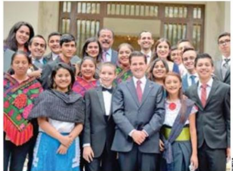
GALARDÓN. El Presidente de México, Enrique Peña Nieto, encabezó la última edición, durante su sexenio, del Premio Nacional de la Juventud.

Aseguró que la ampliación de la cobertura de Internet "está favoreciendo que la juventud mexicana pueda crear hoy plataformas de emprendimiento. Refirió que el comercio electrónico "ha venido creciendo de manera muy significativa, y el 50% de ese comercio lo hacen preci-