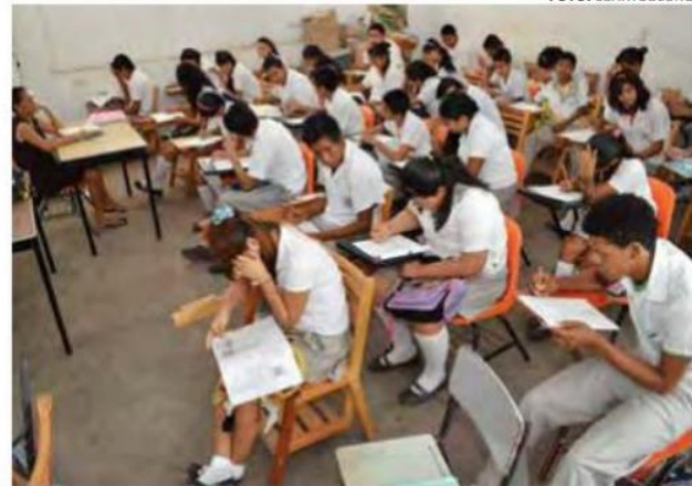
GRADO. Alumnos son evaluados mediante la prueba PISA.