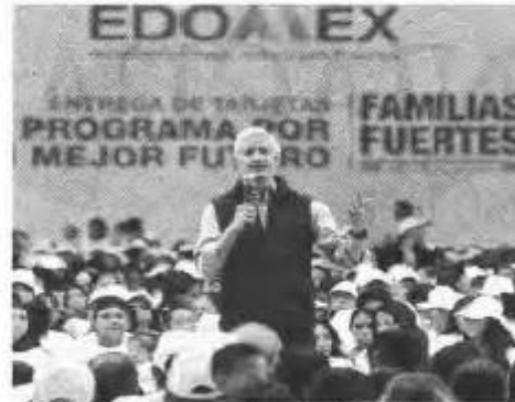
TECÁMAC.- El gobernador Alfredo del Mazo reconoció la labor que hacen las mamás menores de 20 años para sacar adelante y educar a sus hijos

En ese tenor, refrendó el compromiso de su administración de seguir apoyando y respaldando a las mamás jóvenes de la entidad.