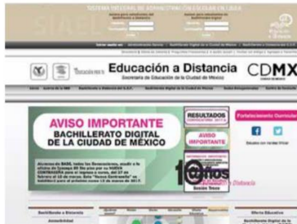
WEB OFICIAL. La página www.ead.cdmx.gob.mx es la única de la CDMX en la que hay inscripciones para el bachillerato en línea.

"Hay una denuncia tanto a nivel federal como local. Entiendo que si hay alguna redirección hacia nuestro sitio, sin embargo, eso será parte de las indagatorias que harán las autoridades competentes, en este caso la Procuraduría de Justicia local y federal", explicó en entrevista con Excelsior .