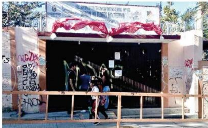
■ Hace unas semanas un estudiante de secundaria fue navajeadado en el interior de una secundaria en Chilpancingo.

de Educación comentaron que en la reunión con la Visitadora de la CEDH se presentó un informe del problema de violencia que existe en mil 300 escuelas de educación básica en 13 municipios de la Zona Centro.