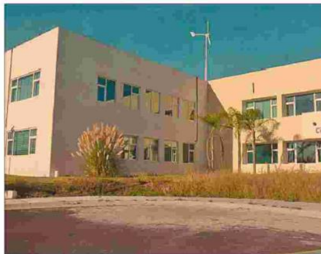
El centro se enfoca en la investigación y el desarrollo de tecnología multidisciplinaria, en el área de ciencia e ingeniería de materiales.

El Cinvestav Querétaro cuenta con una cartera de clientes de 50 empresas de diversas ramas: aeronáutica, farmacéutica, automotriz, informática, energética, alimenticia y de seguridad, entre otras