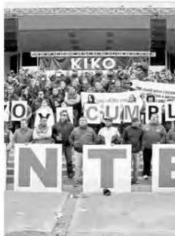
Jubilados exigen pago al gobierno de BC

En Tabasco también hubo protestas de la sección 29 y las vialidades de Villahermosa resultaron colapsadas, mientras que en Chiapas, maestros de la Coordinadora Nacional de Trabajadores de la Educación (CNTE) mantienen su bloqueo en Tapachula, al que se sumaron maestros de la sección 40 del SNTE para exigir el pago de pagos, salarios y prestaciones.