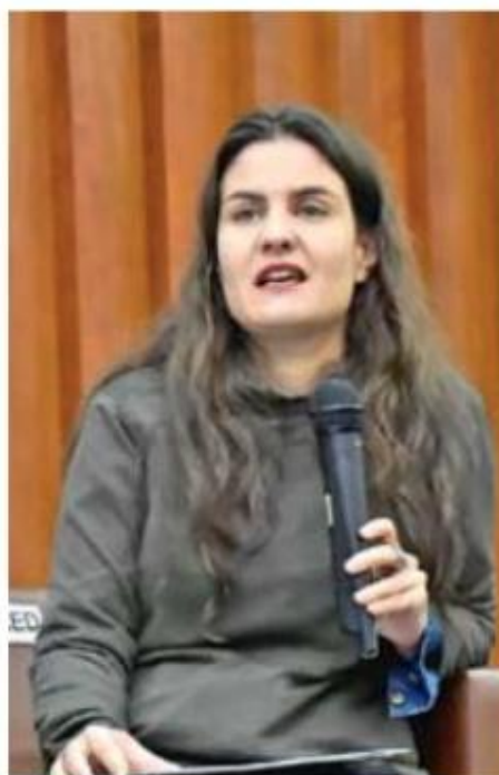
PROBLEMA. Alexandra Haas, presidenta del Conapred, dijo que la brecha crece con la edad.

Finalmente, la titular del organismo señaló que, tanto en las instituciones de carácter público, así como en el sector privado, no se cuenta con docentes preparados para dichas tareas, aunque, en el mejor de los casos, se echa mano de las escuelas que se enfocan en los alumnos con discapacidad, pero para quienes habitan en una zona rural, dijo, éstas son inaccesibles.