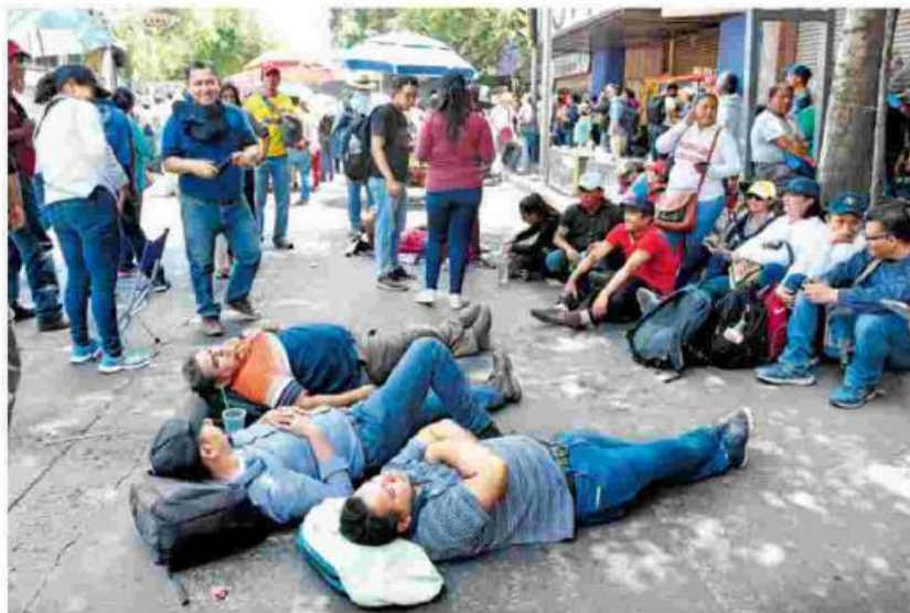
Profesores dejaban de lado sus actividades para acudir a las marchas.