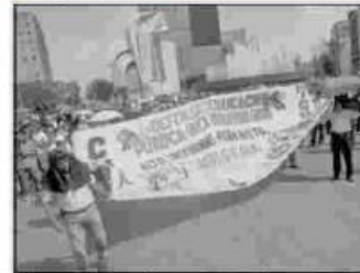
El mandatario argumentó que centralizar el pago evitaría las marchas de los maestros.

servicio es deficiente. Entonces, ¿qué estamos proponiendo? La integración”.