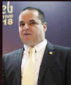
Enrique Velázquez , actual diputado por el PRD, es el líder de Hagamos.

Luego de la debacle del PRD en Jalisco, partido integrado por los principales cuadros políticos de la Universidad de Guadalajara, el grupo que controla la casa de estudios busca crear un nuevo organismo político con independencia a su alianza con MC