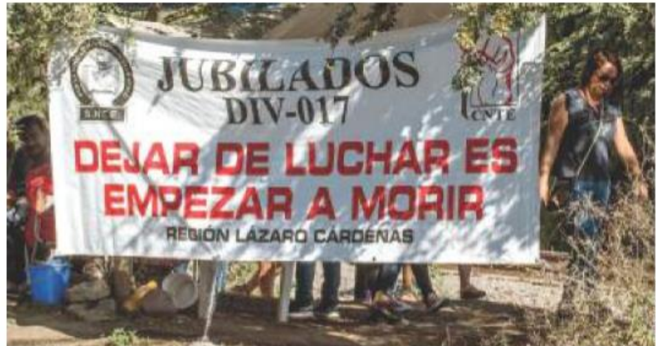
MAESTROS de la Coordinadora bloquean las vías del ferrocarril en Lázaro Cárdenas.