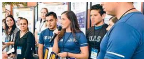
Los propios alumnos exponen las cualidades de los programas.