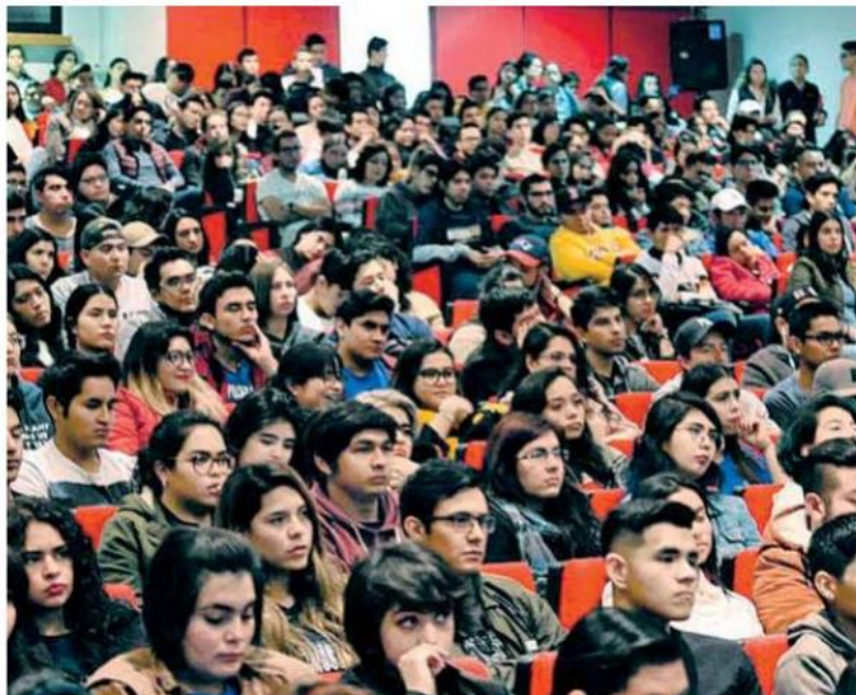
Expertos debatirán sobre la relación entre la gratuidad educativa, la equidad y la inclusión social.

En la iniciativa destacan temas como el ingreso, promoción y permanencia de los docentes de educación básica y media superior; el perfil del organismo que se encargará de establecer