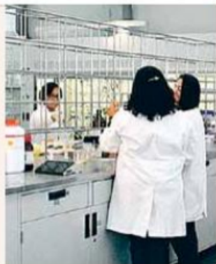
El Conacyt buscará que el recorte presupuestal no afecte sus actividades.

“No habrá recorte de áreas, no habrá tal afectación. Ni siquiera un paro o disminución en la velocidad de trabajo de sector alguno. Si me preguntas cómo le vamos a hacer si tenemos menos dinero, vamos a ahorrar mucho con el llamado outsourcing . El Consejo tenía varias de