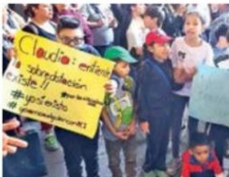
NIÑOS. Las pancartas de los menores rezaban: “No somos invisibles”, “Existimos” y “Sumamos al país”.

Explicó que los menores que tienen un coeficiente intelectual de 130 puntos o más requieren una forma distinta de aprendizaje, debido a que tienen otras inquietudes y capacidades, por lo que no tendrían que estar incluidos en el programa Niños Talento, como pretende el Gobierno capitalino. /NOTIMEX.