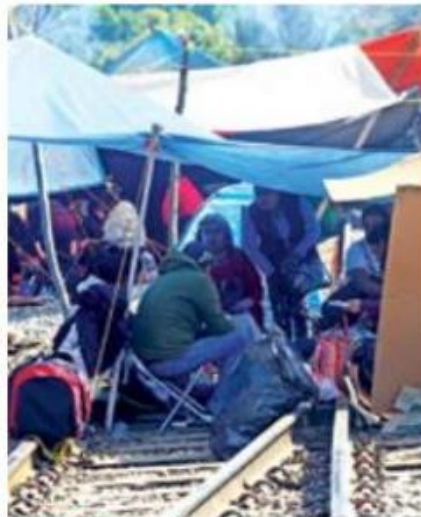
CONTINÚAN. Los bloqueos a vías del tren siguen en algunos tramos de Michoacán.

La Asociación Mexicana de Ferrocarriles (AMF), a través de su cuenta de twitter, ba-