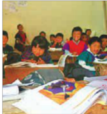
La importancia de la profesionalización docente permitirá una mejor educación.