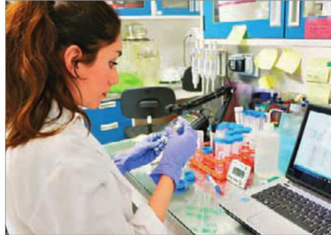
El nuevo momento de acuerdos e inclusión se materializará de forma importante este miércoles, cuando se lleve a cabo el primer Conversatorio para el análisis del Sistema Nacional de Ciencia Tecnología e Innovación en la Cámara de Diputados.