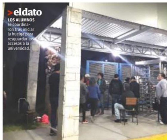
> eldato LOS ALUMNOS se coordinaron tras iniciar la huelga para resguardar los accesos a la universidad.

Incluso los espacios estarán abiertos hasta el martes, informó la universidad.