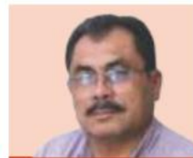
Casimiro Zamora Diputado de Morena

“Reforma Educativa me parece que es el que tiene mayor prioridad después de la Guardia Nacional. La próxima semana pudiéramos ya estar abordándola”