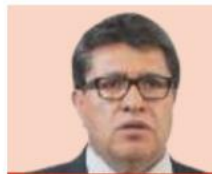
Ricardo Monreal Líder de senadores de Morena

Legisladores se pronunciaron sobre la propuesta y la posición de la CNTE al respecto.