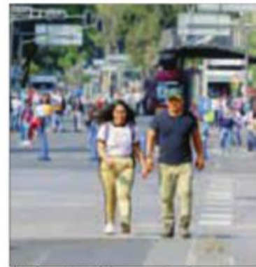
"No hay Metrobús, a caminar".

Los manifestantes partieron al mediodía de este miércoles desde el Ángel de la Independencia en dirección al edificio de Reforma 93, en donde los inconformes, a través de un sistema de sonido, hicieron llegar el mensaje de que no bajarán sus pretensiones del 20 por ciento directo a su salario.