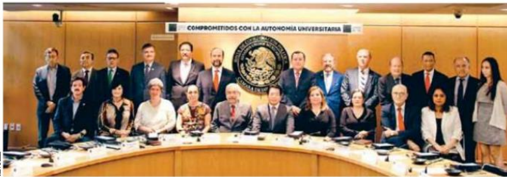
- Fortaleza. Autoridades educativas y legislativas coincidieron en que las universidades son fundamental para el desarrollo del país.