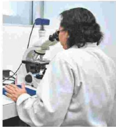
Para legislar piden esperar que ciencia