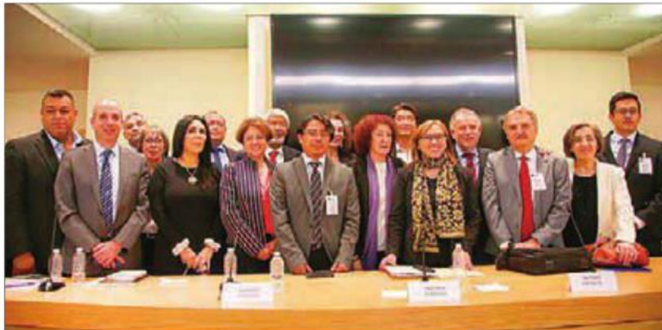
El encuentro formó parte del Conversatorio para el análisis del Sistema Nacional de Ciencia, Tecnología e Innovación, realizado en la Cámara de Diputados que continúa la próxima semana.

Antes de la primera mesa, la inauguración del Conversatorio estuvo a cargo de la presidenta de la Comisión de Ciencia y Tecnología de