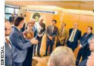
Se acordó continuar con este tipo de encuentros.

dad durante la negociación presupuestal de finales del año pasado, para dotar a las universidades del país de recursos suficientes en el Presupuesto de Egresos de la Federación 2019.