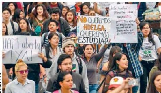
- Paros laborales. Las huelgas operan contra las necesidades coyunturales de las casas de estudio.

Se trata de un esquema, como lo advierten los legisladores de oposición, que, de prosperar podría implementarse en otras instituciones y organismos que tienen autonomía frente al Ejecutivo local. ●