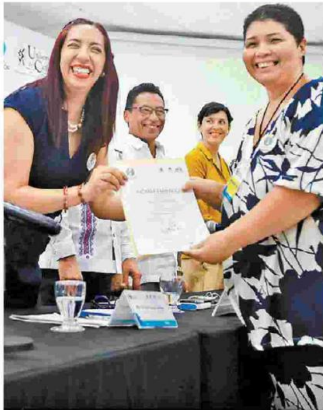
La secretaria de Educación dio reconocimientos. J. CARBALLO