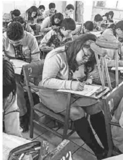
El 66 por ciento de los estudiantes están en en nivel más bajo

Los alumnos de educación básica y medio superior carecen de los conocimientos fundamentales en matemáticas