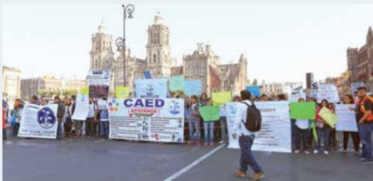
Las manifestaciones estuvieron encabezadas por el Centro de Atención para Estudiantes con Discapacidad (CAED), que protestó para exigir espacios y recursos para trabajar con las personas que atienden.