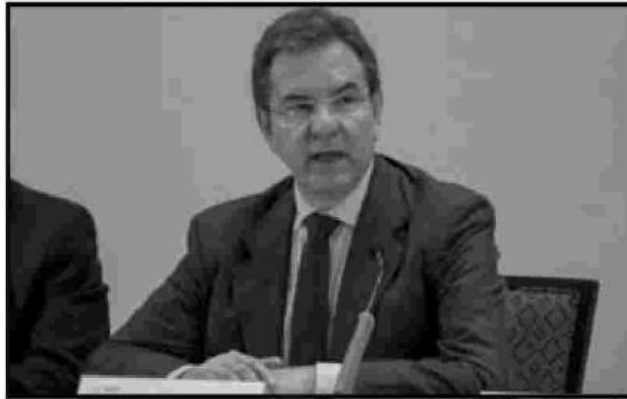
Esteban Moctezuma. Becas, entre lo más destacable.