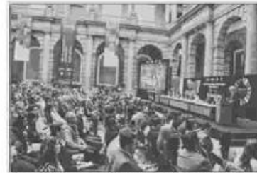
La presentación de la red se realizó en el Palacio de Minería.