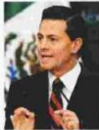
Enrique Peña Nieto

Aunque usted no lo crea hay al menos una similitud entre el presidente Andrés Manuel López Obrador y el expresidente Enrique Peña Nieto . Nos hacen ver que el presidente López Obrador hizo una comparación muy rara de las cifras de seguridad. El mandatario tomó el periodo de 2018, del sexenio de Peña Nieto, para comparar los primeros 100 días de su gobierno en cuanto a homicidios y robo de autos. Resulta que las cifras coinciden, es decir, la incidencia en esos dos delitos fue similar en la actual administración a la del gobierno que tanto ha criticado.