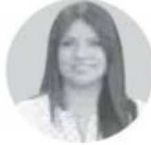
INDIRA KEMPIS SENADORA DE LA REPÚBLICA POR MOVIMIENTO CIUDADANO

La reforma educativa ha sido una de las batallas más grandes que ha dado el gobierno federal por la modernización de los sistemas de estudio, y del sindicato más grande de América Latina por tener mejores prestaciones junto con mejorar las condiciones laborales. En este estire y afloje, el país ha sufrido un sinfín de bloqueos, manifestaciones, mesas de diálogo en las secciones de los dos sindicatos en diferentes estados de la República, principalmente en los estados del sur. Dentro de las negociaciones se pide simplemente mejorar la calidad de vida de muchos maestros rurales que se han visto marginados por la estructura gubernamental; es muy bien conocida la gran deuda que se les tiene, no de ahora sino de hace muchos años. Mucho ha faltado la intervención de los gobiernos estatales y municipales para mejorar en el tema de infraestructura, de acceso, junto a la construcción de escuelas para