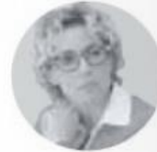
ALEJANDRA LAGUNES SENADORA DE LA REPÚBLICA POR EL PVEM

a las nuevas reglas que, en materia de educación, Andrés Manuel López Obrador prometió en su campaña electoral. Sin embargo, dicha iniciativa ha traído inconformidades por parte de la CNTE y del SNTE; muestra de ello fue la semana pasada, cuando integrantes de estas dos organizaciones tomaron los edificios de la Cámara de Diputados y del Senado de la República y llevaron a cabo movilizaciones y bloqueos como una manera de manifestarse en contra de algunos de los puntos que contiene dicha reforma, particularmente el que tiene relación con la eliminación de las evaluaciones de los maestros y regresar al "pase automático", así como que en caso de que se lleven a cabo, que no sean determinantes, sino que sólo sean parte de un seguimiento a su labor.