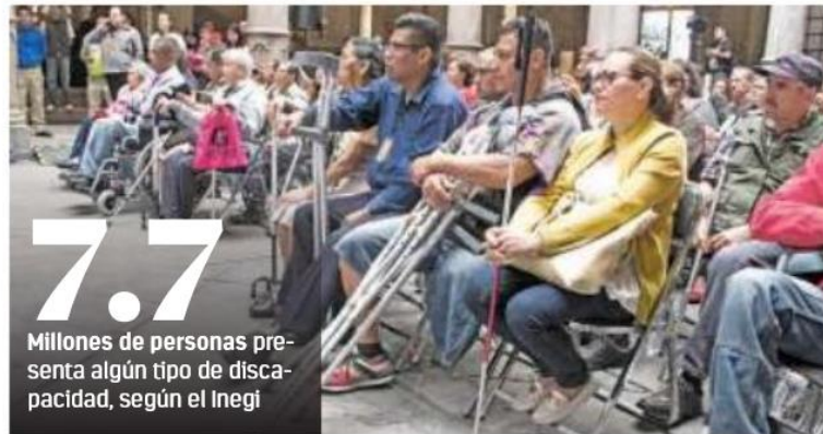
7.7 Millones de personas presenta algún tipo de discapacidad, según el Inegi

CONAPRED SEÑALA que tan sólo 27.5% de la población de 15 a 24 años cuenta con algún grado de educación básica; indígenas, con más rezago