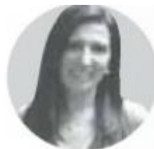
KENIA LÓPEZ SENADORA DE LA REPÚBLICA POR EL PAN

A seis años de la promulgación de la reforma constitucional en materia educativa, presentada por el entonces presidente de la República Enrique Peña Nieto, se pretende legislar nuevamente en esta materia. Sin lugar a dudas el reto es grande, pues no sólo consiste en crear acuerdos, sino en algo aún más trascendente y esencial: la edificación de un sistema educativo eficaz y a la vanguardia de las exigencias globales. De acuerdo con estadísticas recientes del Instituto Nacional para la Evaluación de la Educación (INEE), actualmente el nivel de escolaridad equivale a secundaria terminada, mientras que en 1960 equivalía a segundo o casi tercer año de primaria terminado. No obstante, el mismo estudio indica que el incremento de escolaridad se ve limitado por los altos índices de desigualdad, pobreza y marginación que vive nuestro país; cabe señalar que ningún derecho se debe