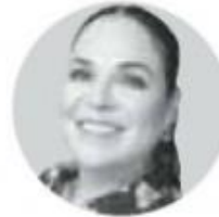
MÓNICA FERNÁNDEZ BALBOA SENADORA DE LA REPÚBLICA POR MORENA

Las reformas legislativas siempre implican un camino complicado de análisis, negociación y aprobación. Este es el caso de la reforma constitucional para transformar la educación pública en México. Como es bien sabido, una de las prioridades del gobierno del presidente López Obrador y de Morena es dar marcha atrás al cambio que se impuso hace unos años sin el consenso de las maestras y maestros. Cuando se aprobó la mal llamada "reforma educativa", se introdujeron en la Constitución una serie de preceptos en el artículo 3° que en realidad estaban lejos de pretender mejorar la educación. Esa reforma sólo era de normas punitivas que buscaban presionar al magisterio, sin que se incluyera en los contenidos de los planes y programas de estudios. Como es obvio, esas nuevas normas recibieron el rechazo de numerosos grupos de maestras y maestros que, organizados en torno a los sindicatos magisteriales o no, manifestaron su inconformidad, pues se trataba de una cuestión