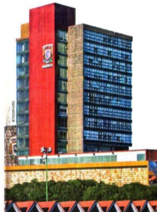
Existen becas para estudiantes de escuelas públicas y privadas. 2