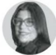
VANESSA RUBIO SENADORA DE LA REPÚBLICA POR EL PRI

La discusión sobre el nuevo modelo educativo de México ha iniciado ya en la Cámara de Diputados. Sin duda será una de las discusiones más profundas y más intensas en nuestro país, dentro y fuera de las aulas, en las calles, en la sociedad civil, en los sindicatos, en el sector privado y en las instituciones. Ha sido evidente que el nuevo gobierno dará reversa a la reforma educativa lograda con anterioridad, pero lo que no queda claro es por qué será sustituida. Hasta la propia Suprema Corte de Justicia ha llamado a actuar conforme al interés superior de la niñez en donde "todas las autoridades deben asegurar y garantizar que en todos los asuntos, decisiones y políticas públicas en las que se les involucre, todos los niños, niñas y adolescentes tengan el disfrute y goce de todos sus derechos humanos, especialmente de aquellos que permiten su óptimo desarrollo". Eso es algo que no se nos debe olvidar: al centro de la educación de nuestro país están los niños, las niñas y los jóve-