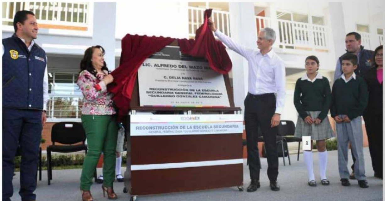
VILLA GUERRERO.- El gobernador del Estado de México, Alfredo del Mazo, devela la placa alusiva a la entrega de la Escuela Secundaria General Federalizada 'Guillermo González Camarena'

"De las 19 mil escuelas que se afectaron en todo el país, cerca de 5 mil, fueron 4 mil 900, las que se afectaron en el Estado de México, es decir, una de cada cuatro escuelas que sufrieron afectaciones con esos sismos están en el Estado de México", hizo notar Del Mazo.