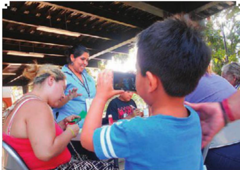
Una de las actividades en la Fábrica de Innovación Creativa para los habitantes de el Tívoli.

En el año 2018, Colima fue el estado de la República mexicana con la mayor tasa de ho-