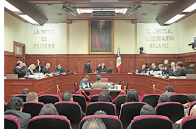
El pleno de la Suprema Corte resolvió 11 de los 26 amparos que están en discusión y que fueron promovidos por el magisterio disidente.

Al no poder justificar el abandono de las aulas, los maestros que mantienen plantones por días e incluso meses podrán ser separados del servicio sin que exista una responsabilidad en la Secretaría de Educación Pública (SEP).