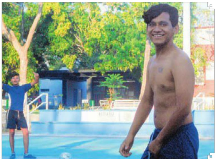
La cancha de futbol donde los jóvenes realizan partidos.