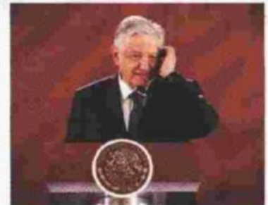
Andrés Manuel López Obrador ha sido duramente cuestionado por la decisión.

A los derechos a la salud, educación, trabajo, así como sus garantías de no regresión, igualdad entre hombres y mujeres y protección al interés superior del menor. Omisión de realizar un test de proporcionalidad sobre la idoneidad de la medida propuesta por el Gobierno de entregar los recursos directamente a los padres y Violación a las garantías de seguridad jurídica y de legalidad por falta de fundamento y motivación.