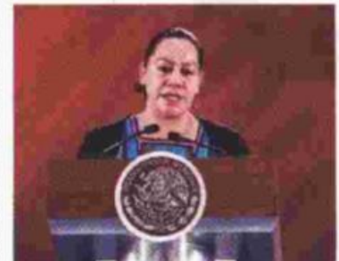
María Luisa Albores, secretaria del Bienestar, se ha encargado de orquestar el nuevo esquema.