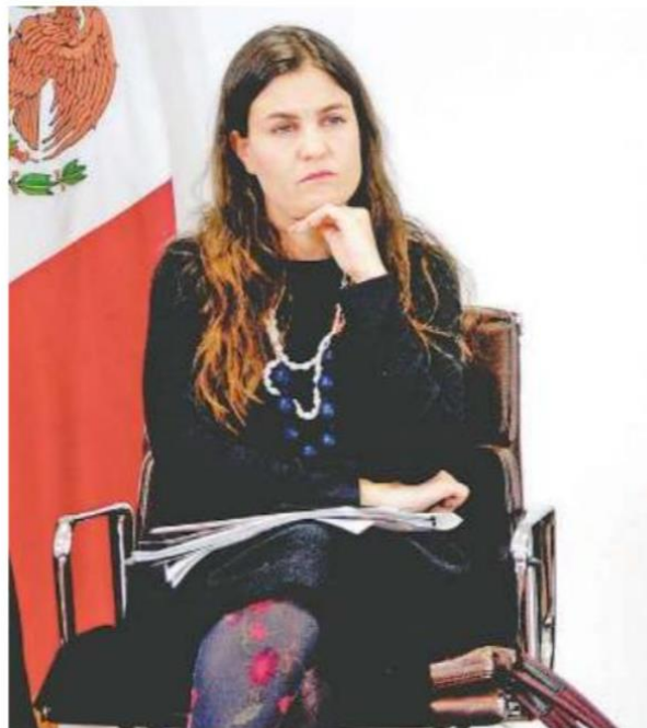
ALEXANDRA HAAS Presidenta del Conapred

ALEXANDRA HAAS ASEGURA que sólo el 60% de las personas con discapacidad terminan la secundaria y el 5% de mujeres indígenas alcanzan una licenciatura