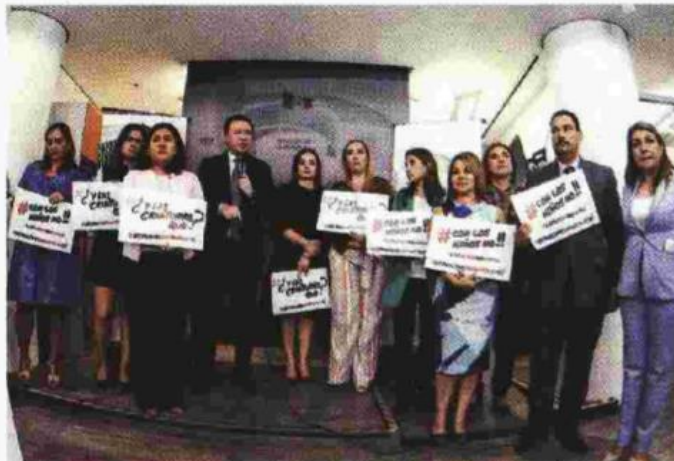
Senadores del PAN y PRI, encabezados por el coordinador priista Miguel Ángel Osorio Chong, expresaron su desacuerdo con la postura del gobierno federal respecto a las estancias infantiles.

alrededor de 26 millones de niños y niñas, son 26 millones de personas".