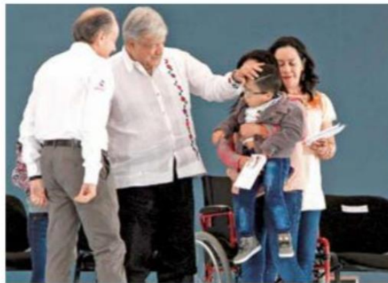
GIRA. El Presidente estuvo en San Luis Potosí, donde entregó apoyos y afirmó que se impulsará la zona para explotar su lado turístico y generar riqueza.

alojo en el Infonavit. Se tiene que arreglar. Se tienen que reestructurar los créditos, porque la gente del Infonavit paga, paga y paga".