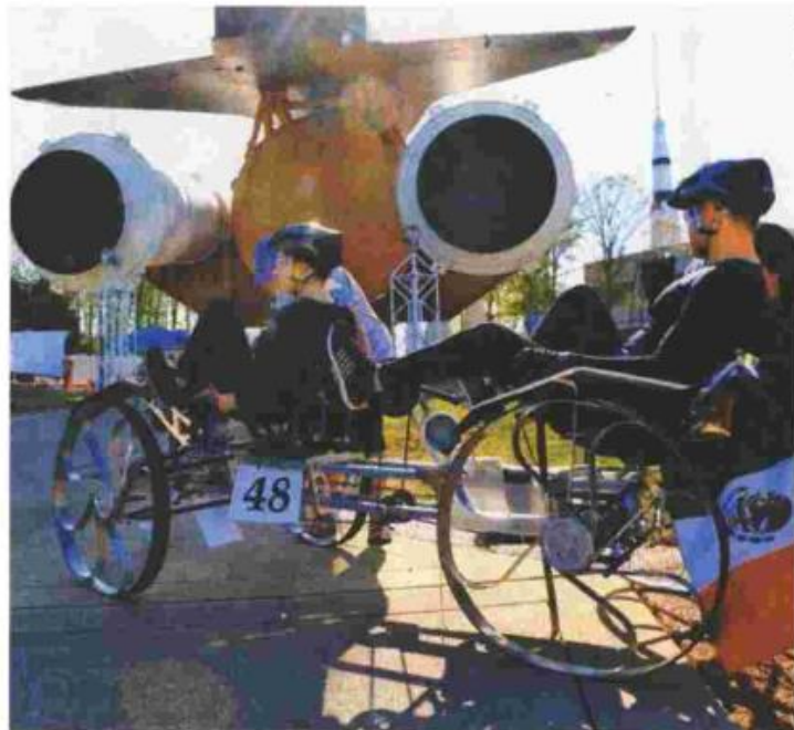
El Roch Team diseñó y fabricó un vehículo de exploración espacial que intentarán llevar al Desafío de Rover de Exploración Humana de la NASA.