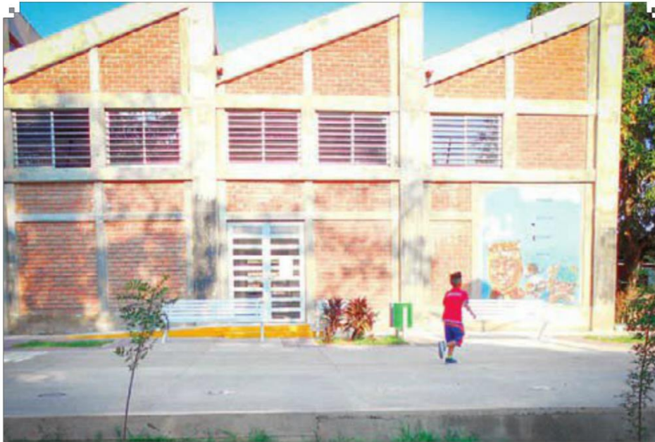
Un niño y el mural de la Fábrica de Innovación Creativa.