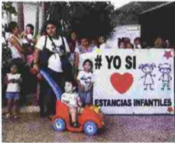
Padres de familia y docentes protestaron en las calles de Xalapa, Veracruz.

Infantil que atienden a menores de 45 días de nacidos a los cinco años de edad.