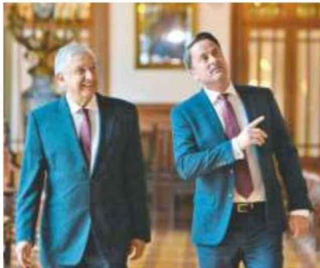
El Presidente recibió al Primer Ministro de Luxemburgo, Xavier Bettel, en el Palacio Nacional, ayer.

"No quiero, así lo digo con toda claridad, que utilicen de excusa algunos dirigentes el que se queden pendientes para sacar provecho, para sacar raja, porque ahí andan viendo si incumplimos, se andan frotando las manos para que puedan decir: "Son