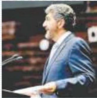
El legislador ayer en tribuna al presentar la iniciativa de reforma. Especial

EL DIPUTADO PRIISTA presentó una iniciativa para evitar incremento en colegiaturas y cobros extra