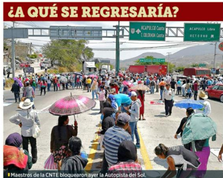
Maestros de la CNTE bloquearon ayer la Autopista del Sol.

En el mismo sentido, opinó Rodolfo de la Torre, del Centro de Estudios Espinosa Yglesias: “Sería una mala decisión regresar a la situación que se daba antes de 2013 y la