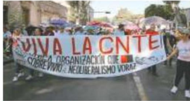
Integrantes de la Coordinadora en manifestación en la CDMX.