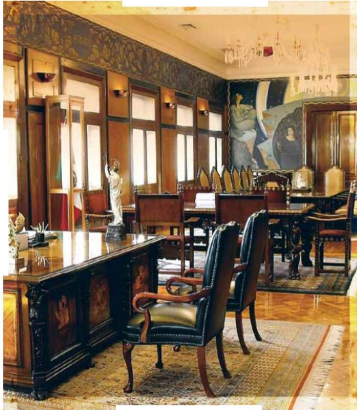
-Maximalismo. Casi cualquier gobierno nuevo tiene la intención de reinventar al país y denostar el pasado.

En general, todo nuevo gobierno, con independencia de si llega con mucho, regular o poco apoyo electoral, tiene una tendencia natural, casi genética, al maximalismo. Es decir, a reinventar el país, y querer hacer cambios radicales en el escaso tiempo que duran los períodos presidenciales donde, presuntamente, no hay (o no debiera haber) reelección. Hay una suerte de entusiasmo juvenil que alimenta la creencia de que todo se vale y todo es posible. Aún se recuerda cómo, cuando ganaron los socialistas en España en 1982, uno de los nuevos ministros prometió: "cambiaremos al país a tal grado que no lo reconocerá ni la madre que lo parió". Muchas cosas cambiaron para bien, desde luego, pero otras no, y la historia sigue su curso a veces