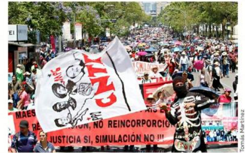
Integrantes de la CNTE marcharon ayer del Ángel de la Independencia al Zócalo.

Después de la protesta, el magisterio instaló su Asamblea Nacional Representativa (ANR), donde organizarán sus próximas manifestacio-