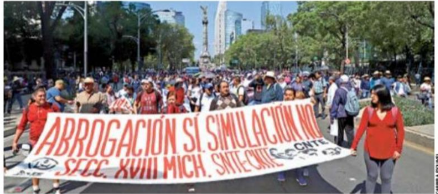
SINPACTOS. La CNTE afirmó que el rechazo de la reforma en el Senado muestra que no hay acuerdo alguno con las autoridades federativas o con los integrantes de la bancada de Morena.

En tanto, en redes sociales se difundieron fotos de Elba Esther Gordillo en una reunión con integrantes del