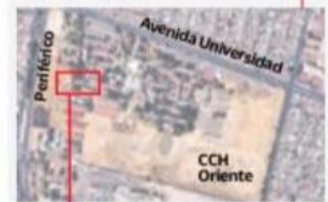
Este es el edificio en donde se encontraba Aideé al momento de recibir un impacto de bala

El CCH Oriente se encuentra en la alcaldía de Iztapalapa, una de las más violentas de la capital del país