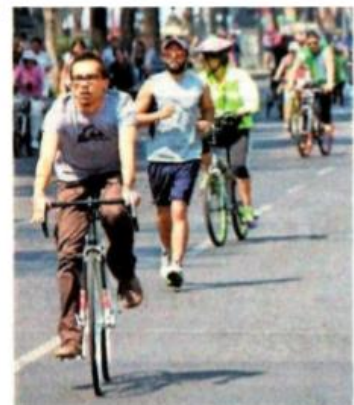
Buscan que la bicicleta se use más en zonas rurales y urbanas.

Destacan las propuestas de fomentar el uso de la bicicleta en espacios urbanos y rurales, así como la adición de una ho-