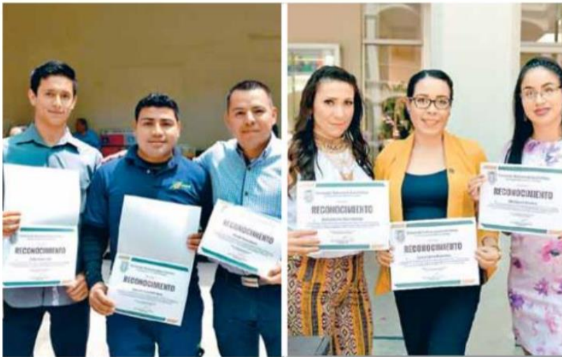
- Reconocimiento. 98 administrativos de tres campus recibieron sus constancias.