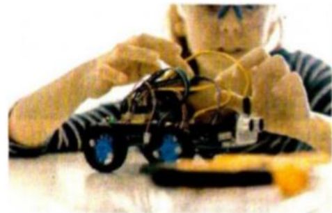
Otro objetivo es fomentar la educación incluyente.

Es por eso que, dentro de las actividades que desean llevar a cabo en este ecosistema está la de la capacitación docente, factor importante para consolidar el acercamiento de los alumnos a este tipo de habilidades. ●