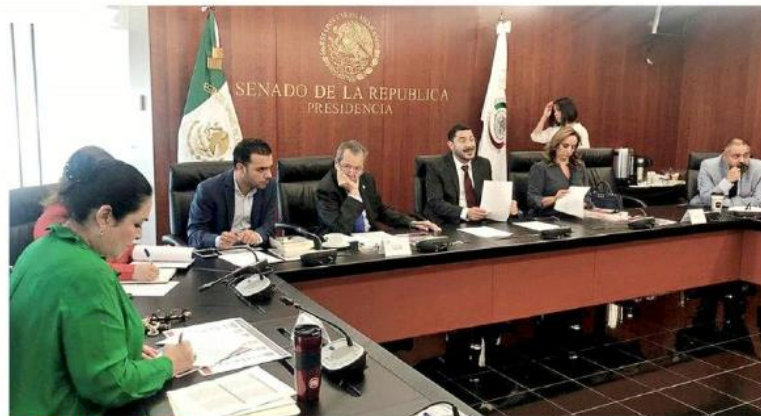
AGENDA DE MAYO. La mesa directiva de la Comisión Permanente del Congreso acordó ayer sesionar el próximo lunes.

“Nosotros estamos seguros, por nuestras pláticas en la Cámara de Diputados, y nuestro contacto con Hacienda y la Secretaría de Educación, que ya tienen todos los elementos que se han pedido. A base de tantos pulimientos,