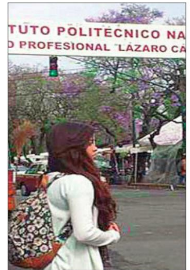
Senderos Seguros se aplicará en 24 sedes del Instituto Politécnico Nacional.