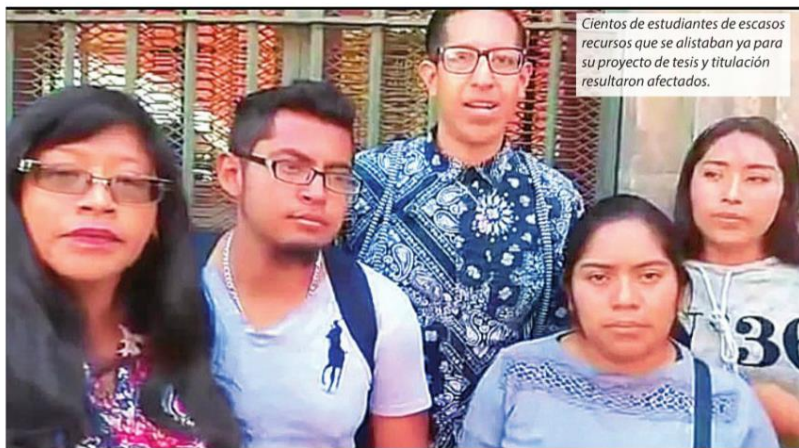
Cientos de estudiantes de escasos recursos que se alistaban ya para su proyecto de tesis y titulación resultaron afectados.