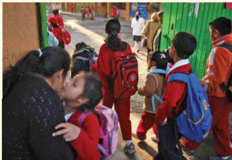
La Prueba Planea 2018 reveló que el 59 por ciento de los alumnos que salieron de 6º de primaria obtuvieron la calificación más baja posible del examen.

Pasar a los alumnos de año aunque no cuenten con los conocimientos marcados en el plan de estudios no es algo nuevo, simplemente se hacía de manera extraoficial